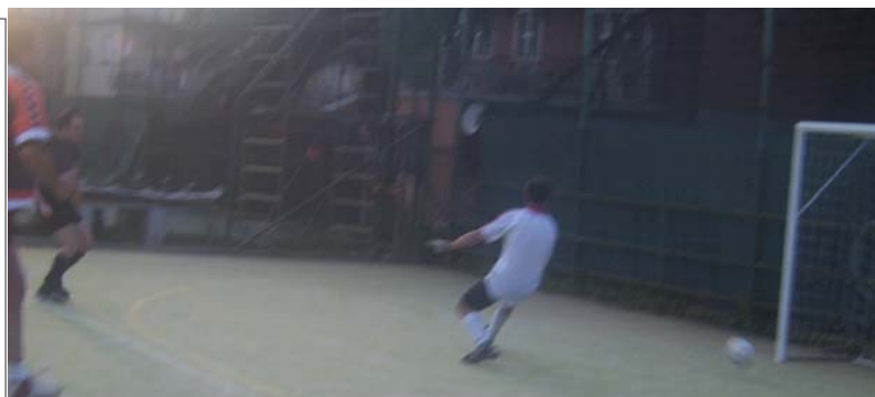
Pelè punisce alla sua maniera un Giaguaro irricognoscibile, Piuma assiste impotente all'infilata.